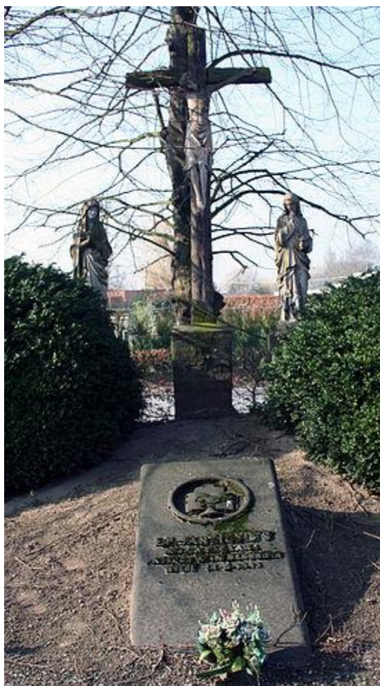
Foto genomen in Sint Franciscushof, Minderbroederstraat te Leuven