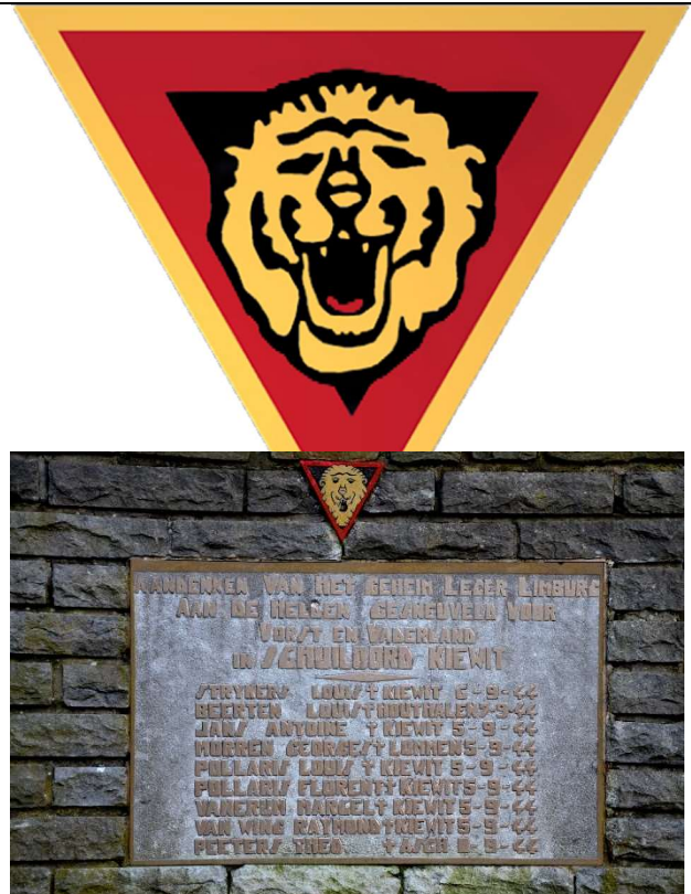
Oorlogsmonument Herk-de-Stad (links) en het monument van het Geheim Leger (rechts) in Kiewit