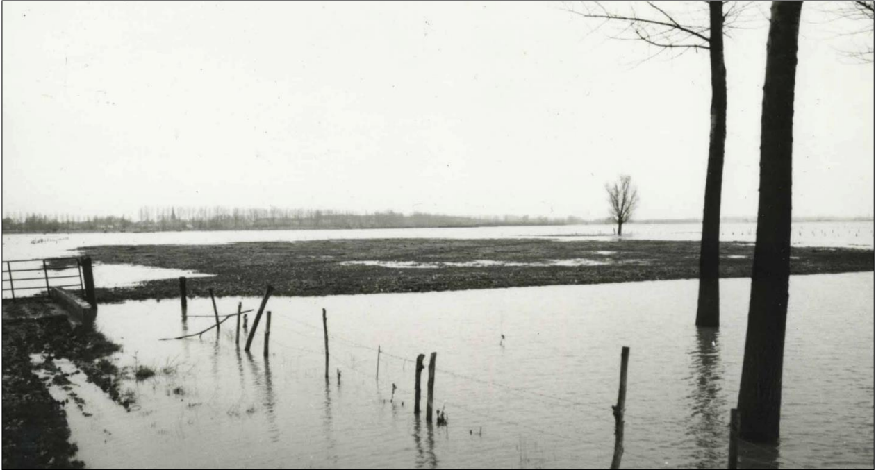
enkel het donk waar ooit de kerk op stond, steekt nog net boven het omliggend water uit. Aan de hand van het metalen hek links, dat er in 2021 nog stond, werd de plaats van de obelisk bepaald.