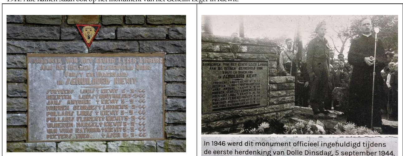
1946: inhulding monument in Kiewit