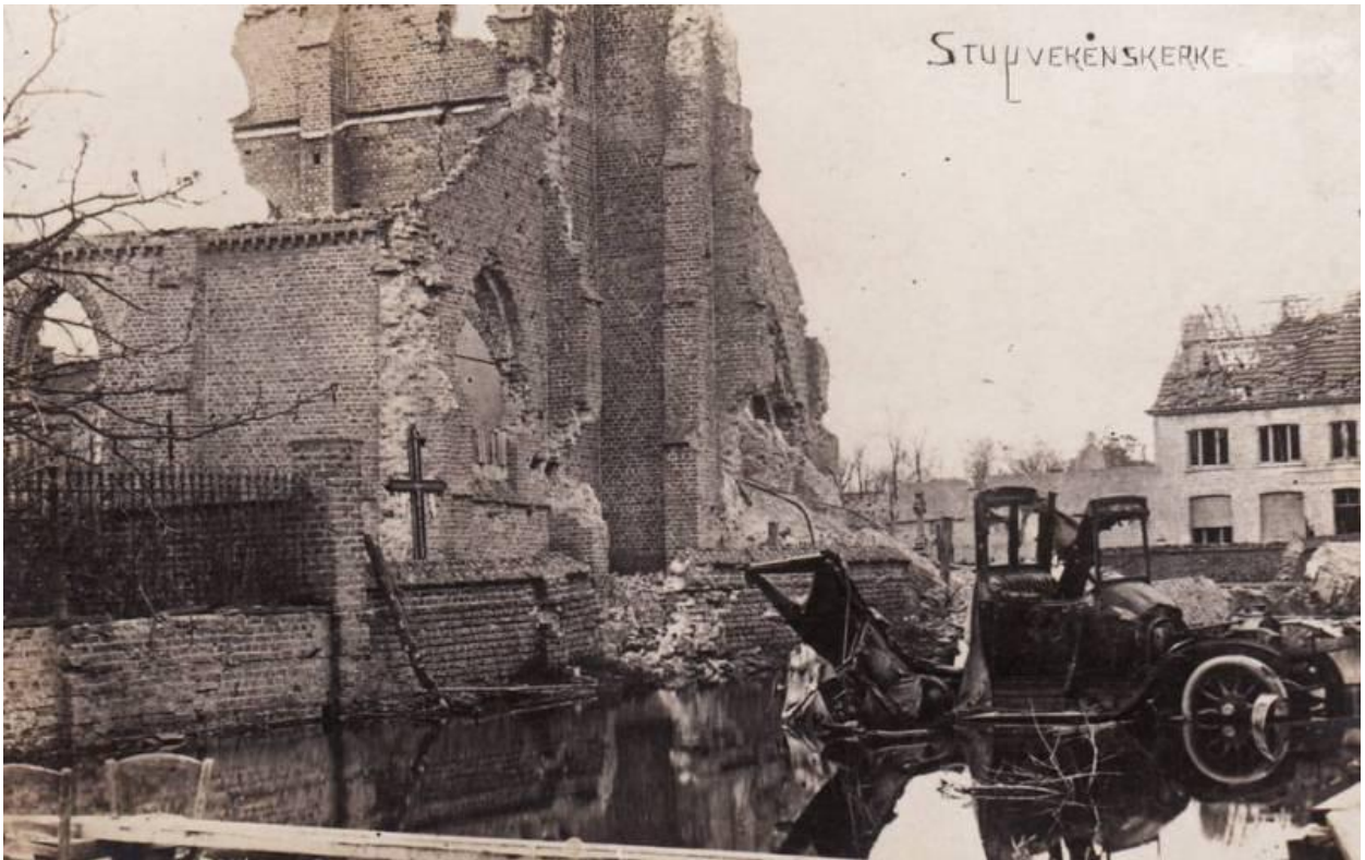
Stuyvekenskerke: door het openzetten van de sluisen, stond het marktplein onder. Een loopbrug, geschraagd door stoelen is op de voorgrond te zien.