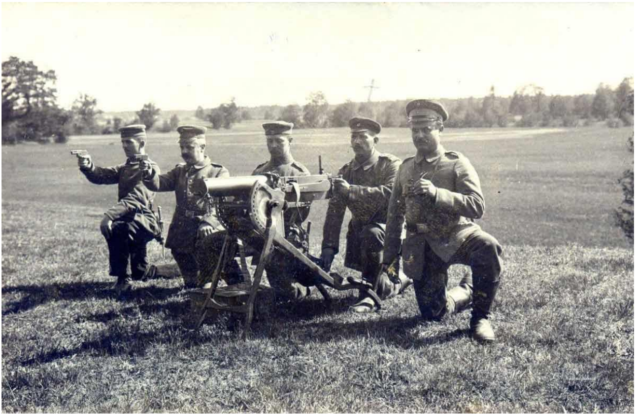
Duitsers in Keiem