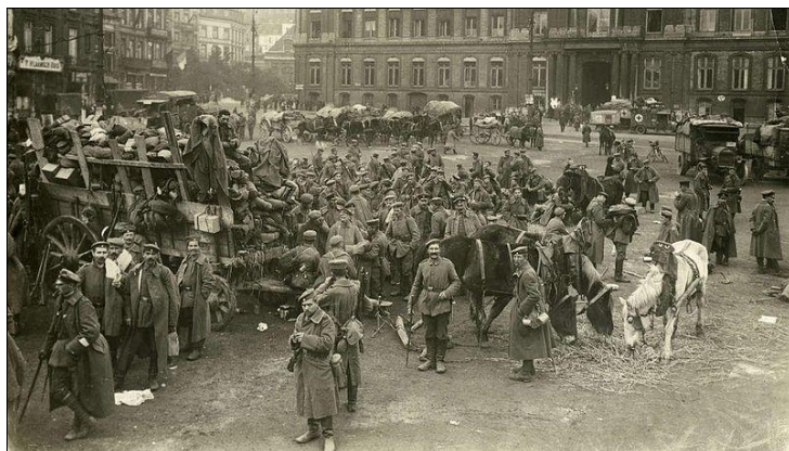
Luik, Belgische troepen verzamelen zich voor het Prins bisschoppelijk paleis.

Toen de oorlog uitbrak was hij net afgezwaaid. Hij behoorde tot de militieklasse van 1912. Was dat jaar op 1 oktober ingelijfd bij het 11 e linieregiment en was er op 30 december 1913 afgezwaaid. Hij werd gewond op 4 augustus 1914 bij de eerste gevechten in Luik en overleed op 7 augustus 1914 in het hospitaal van die stad. Hij werd begraven op het kerkhof van Robermont.